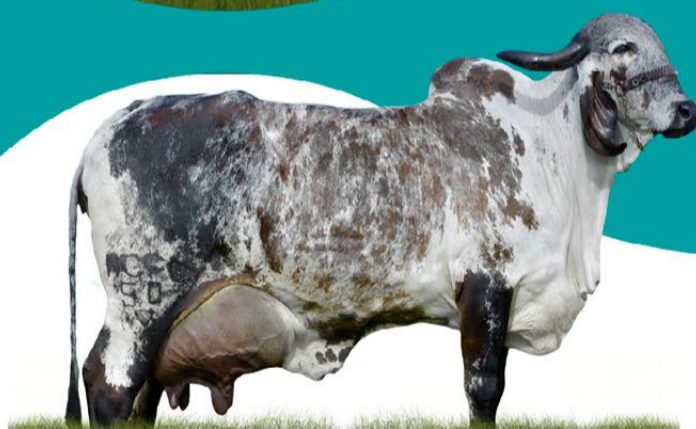
FIGO ANGRA FIV - MÃE