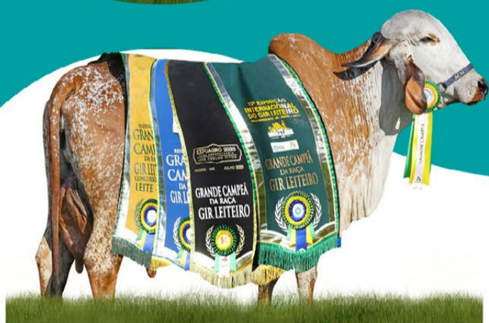
DALILA I FIV DA YPE - MÃE