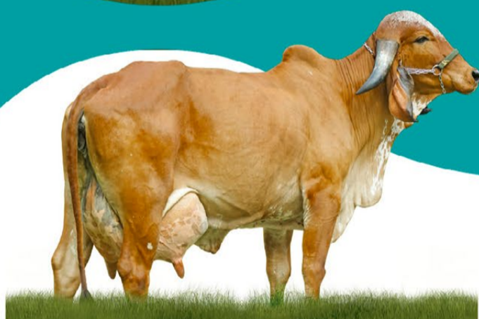
DONA FLOR - MÃE