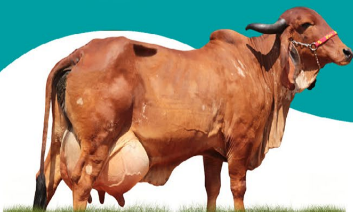
ILMA DE BRASÍLIA - MÃE