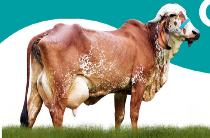
JULIANNE FIV DO BASA - MÃE