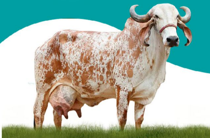
ESCOCIA DA BDL - MÃE