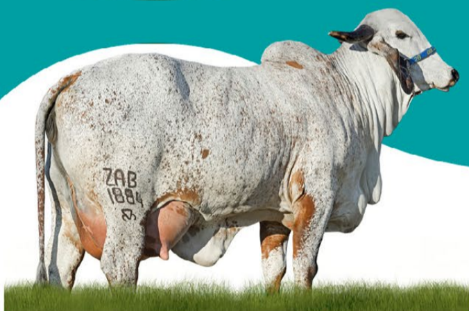
BONDADE FIV 2B - MÃE