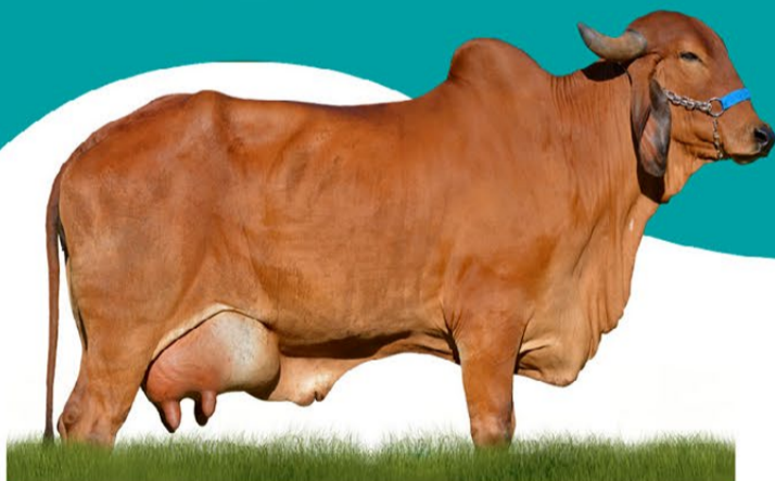
HEDNA DO BASA - MÃE