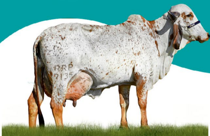
LETÔNIA FIV DE BRASÍLIA - MÃE