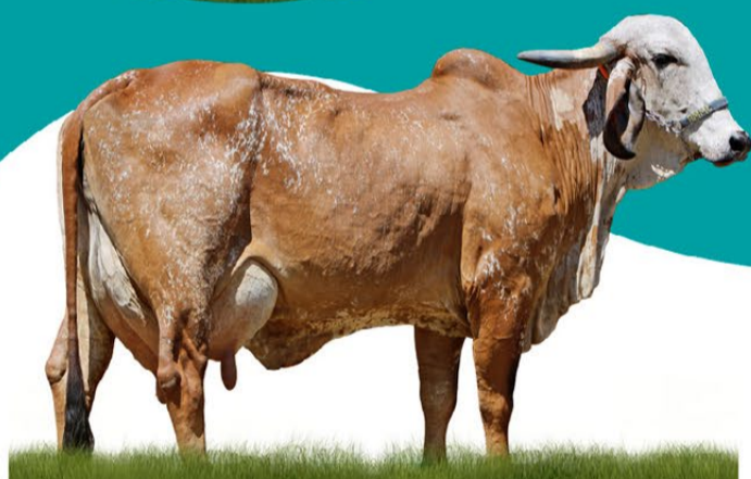
EXIXA FIV JMMA - MÃE