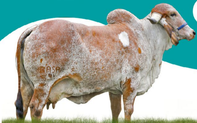
BAGÉ FIV DO BASA - MÃE