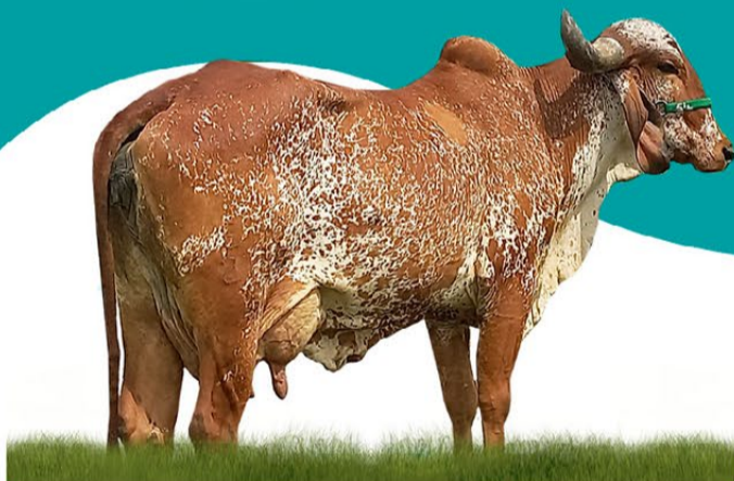
TÔNICA FIV SILVANIA - MÃE