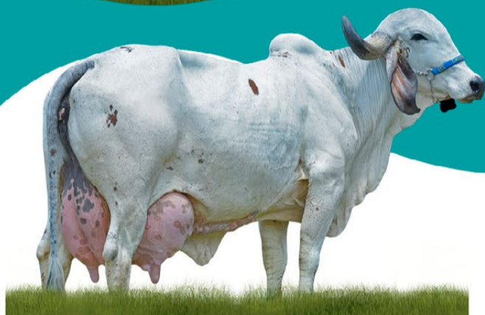
FÁBRICIA FIV HRA - MÃE