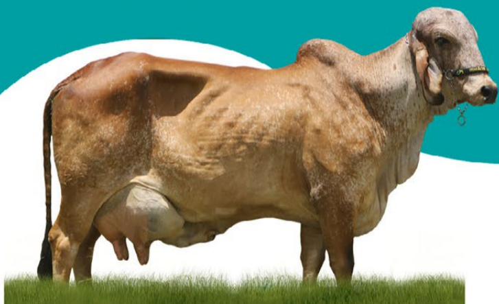
ICH NENI - MÃE