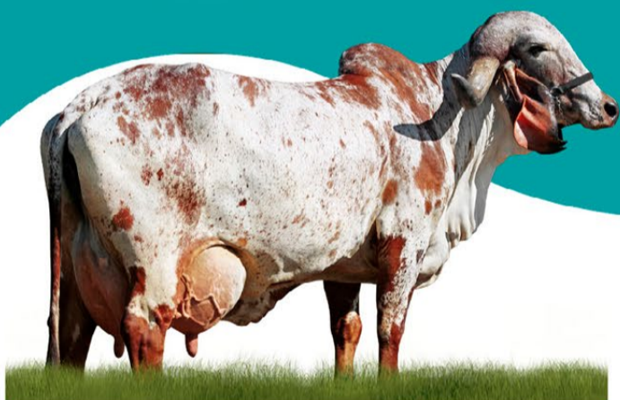
GAROA FIV CABO VERDE - MÃE