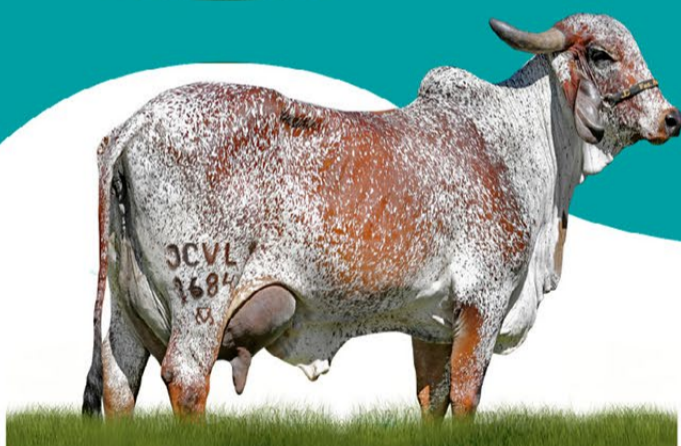
ATENAS FIV CABO VERDE - MÃE