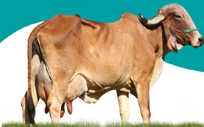
COLOMBINA DA BADAJÓS - MÃE