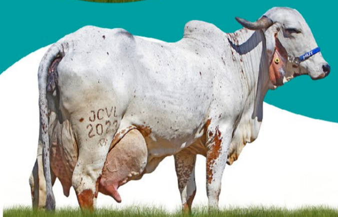
BROINHA FIV CABO VERDE - MÃE