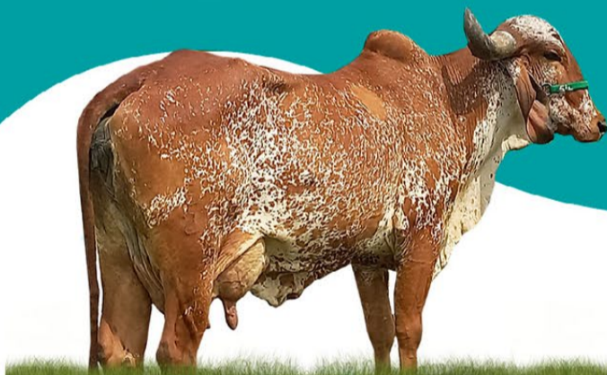
TONICA FIV SILVANIA - MÃE